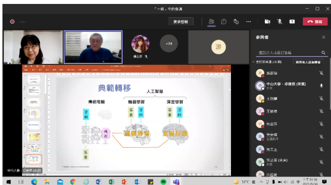
講者分享相關研究議題之剪影