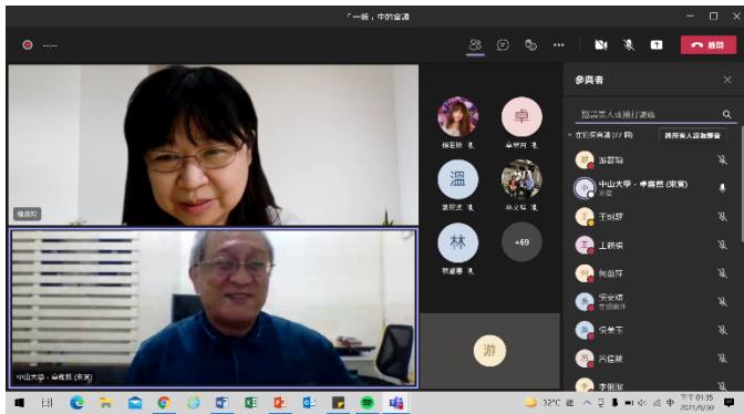
講者及本系主任對談剪影