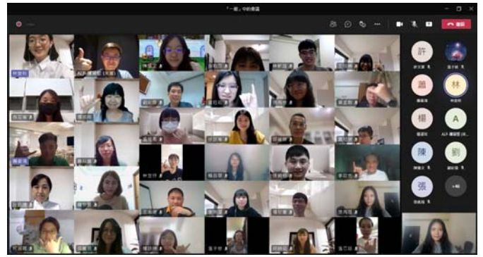
講者及與會者大合影