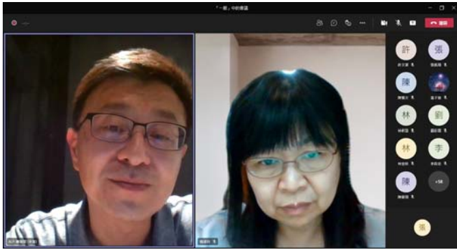
講者及本系主任對談剪影