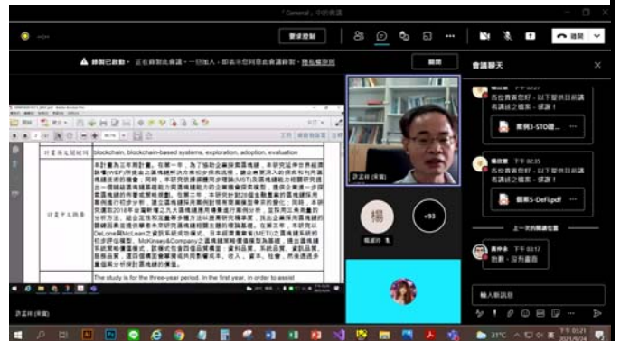
講者分享相關研究議題之剪影