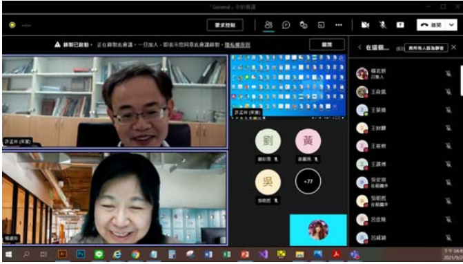
講者及本系主任對談剪影