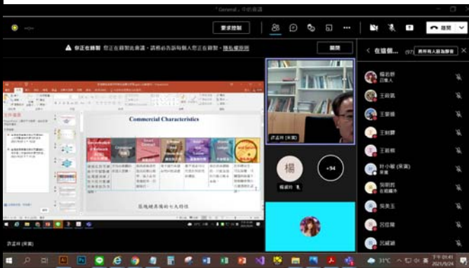
講者分享相關研究議題之剪影