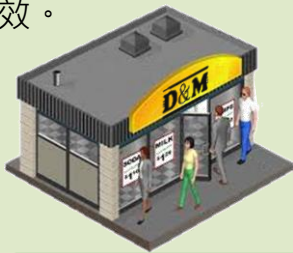
競賽軟體(VBR)- 商店門市示意圖

本活動採用『3D零售模擬系統(Virtual Business Retailing)』為競賽標的，進行零售模擬營運，運用所學之行銷技術，提出最佳零售營運決策，透過決策後所得之具體成效。