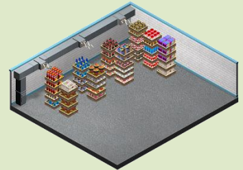
競賽軟體(VBR)- 商店內倉儲區示意圖