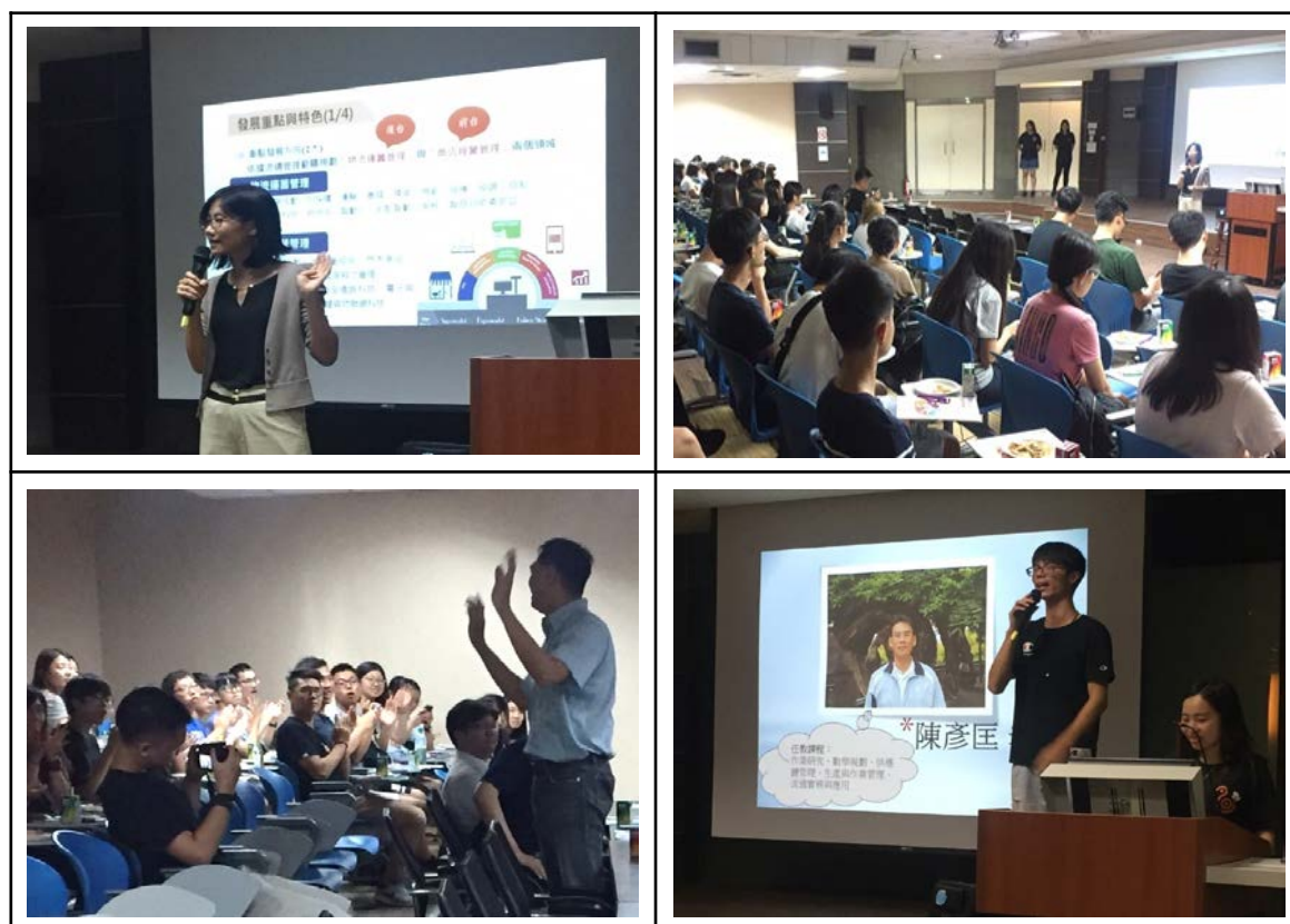
▲圖四 大學部新生始業座談